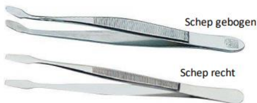
Figuur 2. Pincetkrommingen

Dan de vorm. De pincet kan aan het uiteinde spits, rond, lepel of schep zijn. Zie de plaatjes. De een is erg handig met een spitse pincet, maar een ander is bang, dat hij met die punt de postzegels beschadigt. Een derde werkt het liefst met een lepel, een vierde met een schepmodel.